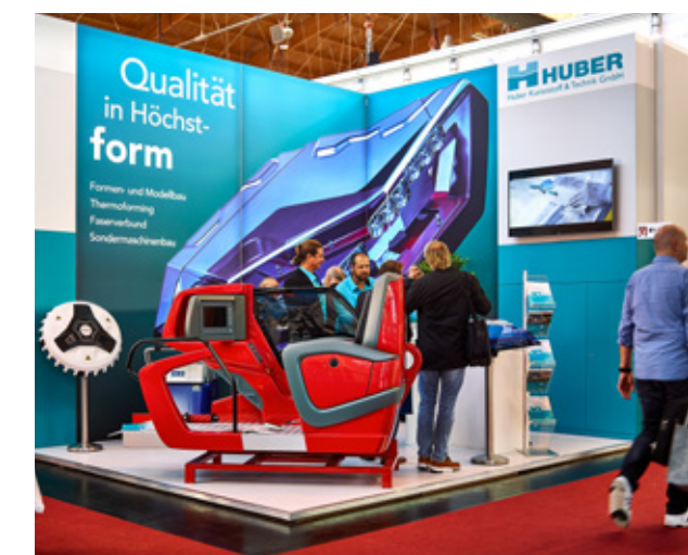
FAKUMA, Friedrichshafen – Huber Kunststoff &amp; Technik GmbH