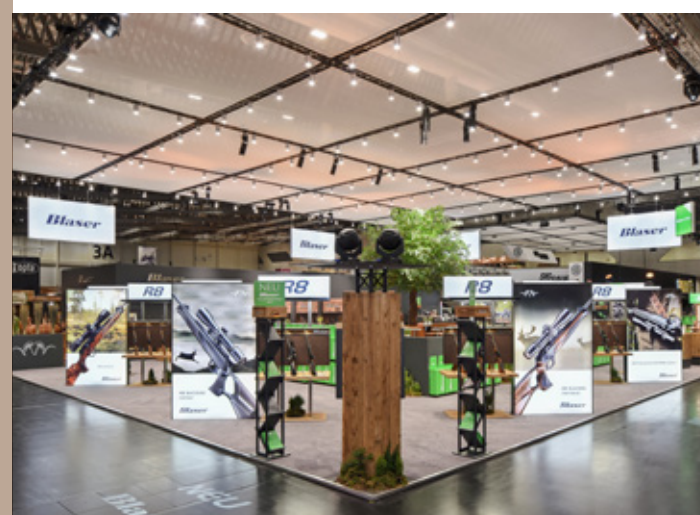
IWA &amp; OutdoorClassics, Nürnberg – Blaser Group GmbH

Aufsehenerregende Messe-Inszenierungen, unaufgeregte Macher: Die MBI Messebau GmbH aus Friesenhofen bei Leutkirch gilt weit über die Region hinaus als Top-Adresse in Sachen „Raum für Visionen“. Selbst üben sie sich eher in Zurückhaltung und überlassen den großen Auftritt ihren Kunden. Als kompetenter Business-Partner bietet MBI schon seit über 27 Jahren das „Rundum-Sorglos-Paket“ für den professionellen Messe-Auftritt: von der individuellen Konzeption über die Vergabe von Auf- und Abbau, der Vermietung von Messemobiliar bis hin zur Einlagerung des kompletten Messestands. MBI bietet ihren Kunden einen umfassenden Komplett-Service. Mehr noch: MBI konzipiert Kommunikationsräume auf Zeit, damit die Präsenz auf Fach- und Verbrauchermessen zur perfekten Kulisse für die erfolgreiche Begegnung wird.