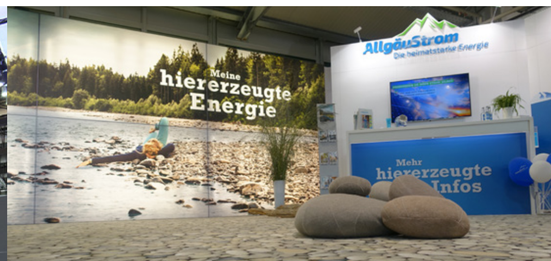
Allgäuer Festwoche, Kempten – AÜW // AllgäuStrom