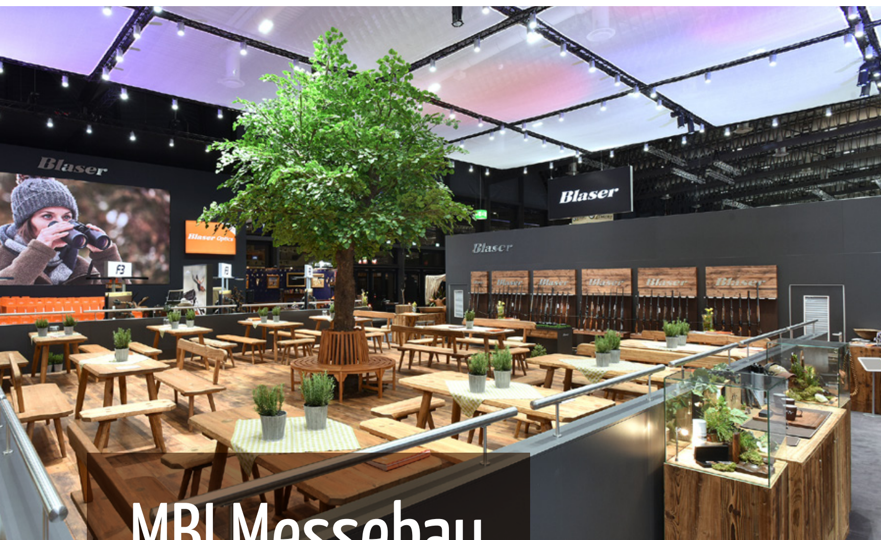
IWA &amp; OutdoorClassics, Nürnberg – Blaser Group GmbH