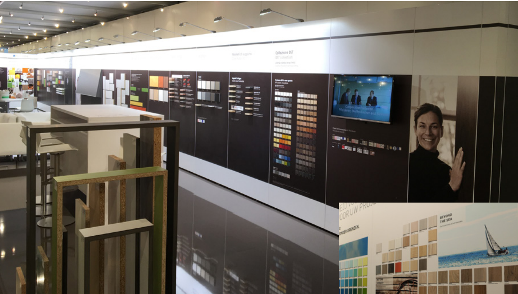
SICAM, Pordenone, IT – Pfeleiderer Holzwerkstoffe GmbH